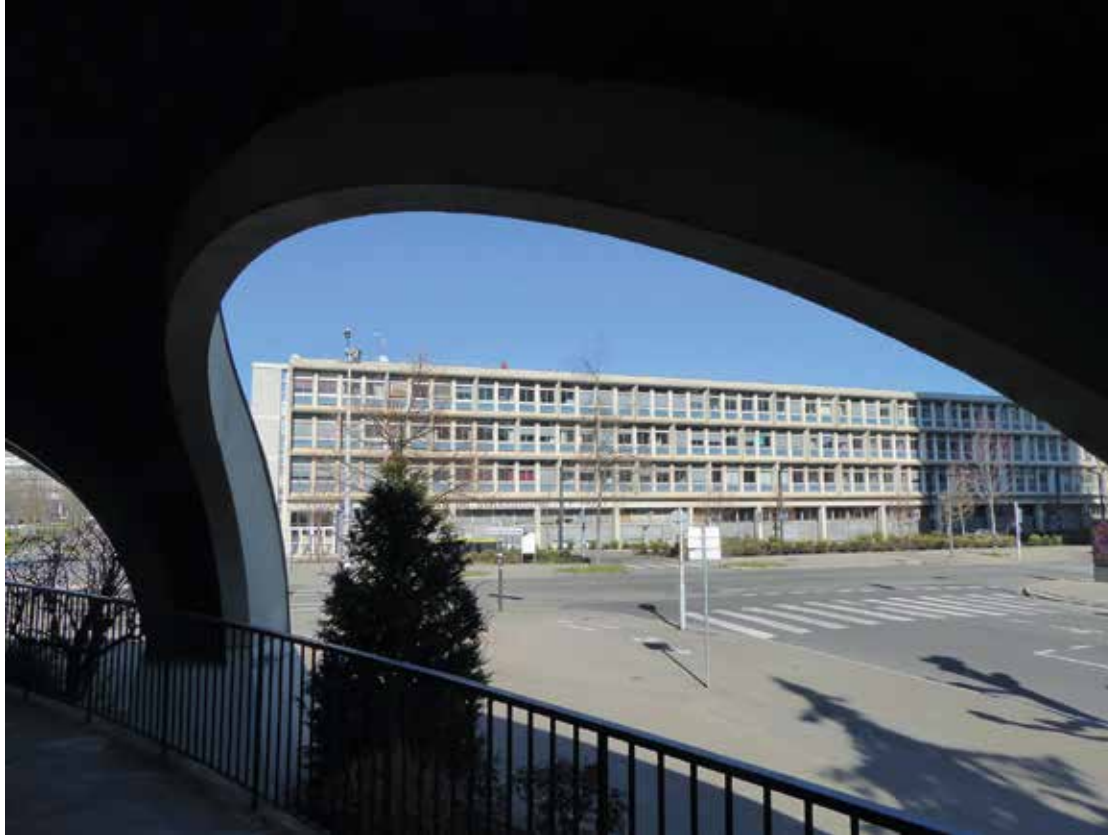
Titre : "Droites et courbes". Photo de Jean-Pierre Beck